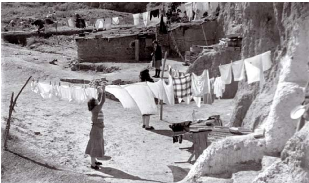
Pisos i més pisos. Els de dalt són al sud-oest del Besòs. L'origen? Situacions com la que es veu a sota: infrahabitatge, barraquisme, coves ocupades.