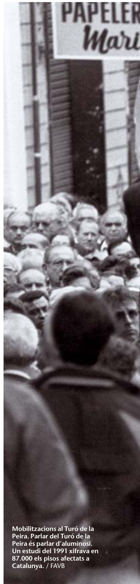
Mobilitzacions al Turó de la Peira. Parlar del Turó de la Peira és parlar d'aluminosi. Un estudi del 1991 xifrava en 87.000 els pisos afectats a Catalunya.

El moviment veïnal actual es va formar emparat per la segona llei d'associacions espanyola, del 1964. La primera va ser del 1887. Es va covar, però, als cinquanta, i algunes entitats pione-