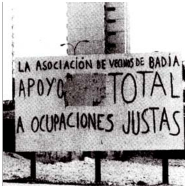
L'abocador del Parc de les Planes (l'Hospitalet de Llobregat). A sota, pis amb aluminosi. Al costat, l'AV de Badia i les reivindicacions sobre el dret a l'habitatge.