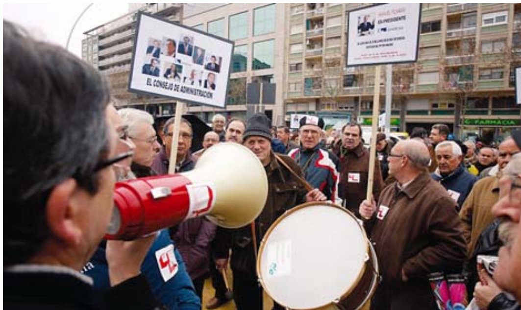
Fent història: una manifestació contra el rebut de l'aigua. Aquesta campanya va durar del 1991 al 1999. A sota, una protesta recent, per la llum.