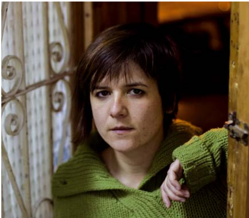
Gala Pin a la porta del local que serveix per a les trobades de l'AV l'Òstia, de la Barceloneta.

És urgent despertar. «Potser és que hem perdut aquella solidaritat, aquell veïnatge en què no hi havia portes tancades», reflexiona Martínez. La crisi generalitzada fa més urgent que mai que els veïns despertin la solidaritat envers els més propers. «S'apadrina un nen amb un donatiu, i està molt bé. Però als barris, al costat nostre, hi ha situacions de pobresa extrema i això, qui ho detecta més fàcilment, és la gent del barri». Si el veí ha de conèixer el veí, no podran perdre de vista mai l'urbanisme, l'espai públic, ni els esforços per engrescar... Casa teva comença al carrer.