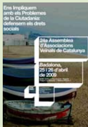
Dos cartells de les assemblees de les AV que mostren dues etapes: la de la protesta i la de la proposta.

Pomar és un barri de Badalona, la ciutat on van veure la llum les dues primeres associacions de veïns de l'Estat: Lloreda i la Pau. Per sobre d'aquest paper que sembla cremar amb la indignació dels que l'han escrit, han passat 41 anys de lluita. El full volant crida a la insubmissió, i ho fa el 1970, cinc anys abans de la mort del dictador.