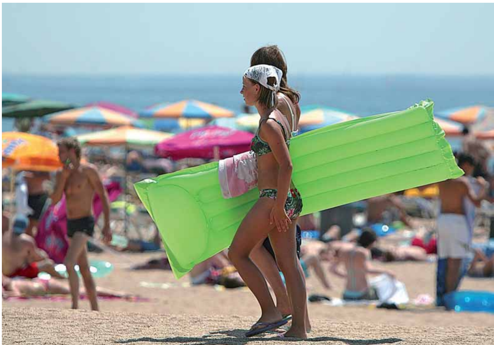
Turistes en una platja de la Costa Brava. MANEL LLADÓ

Núm. 2157. Any XLVIII. ■ Diumenge, 30 de juny del 2013 ■ www.presencia.cat