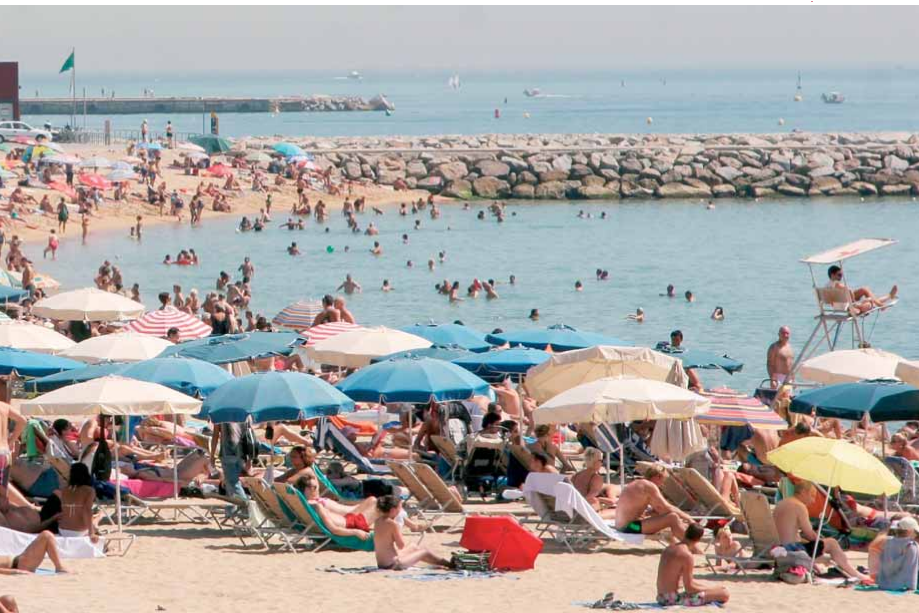
Imatge de la platja de Barcelona plena de gom a gom. A l'esquerra, r les platges que han obtingut bandera blava. J. SOTERAS